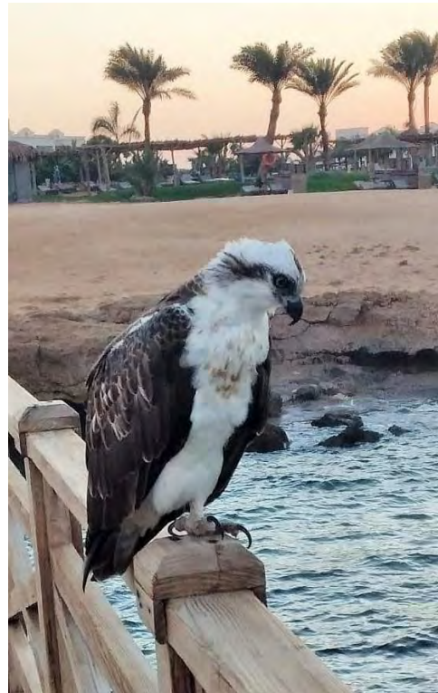
Ein Seeadler am Roten Meer fotografiert.